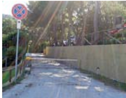
La sbarra elettrica a Pinus Village (i.m.)

Una beffa insomma. Per lasciarsi alle spalle Pinus Village è necessario infrangere il codice della strada. Ma la cosa preoccupante è che, se dovesse scoppiare un incendio o qualcuno